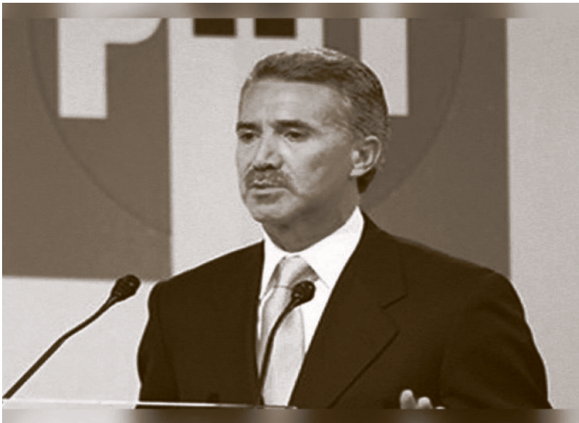
Roberto Madrazo, candidato del PRI a la gubernatura de Tabasco.