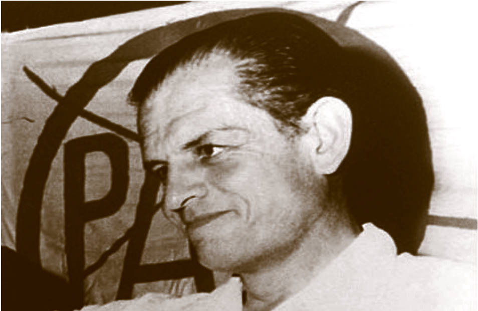
González Morfín, candidato del PAN