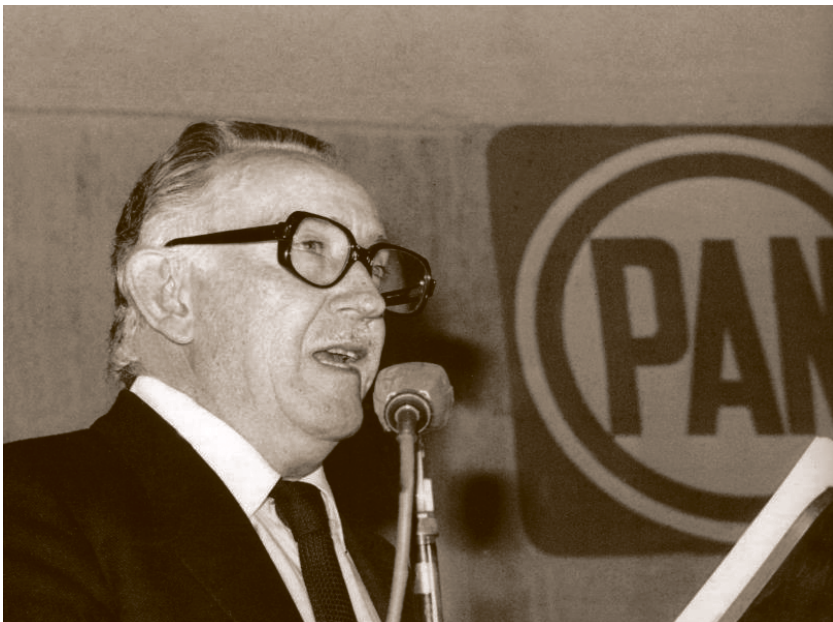
Pablo Emilio Madero, candidato del PAN