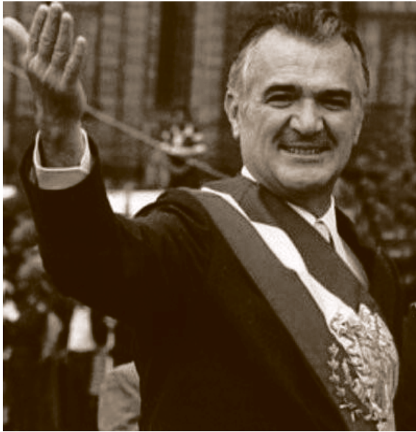
Miguel de la Madrid Hurtado, Presidente de México (1982 1988)