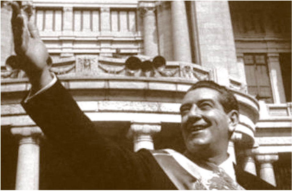
Adolfo López Mateos, Presidente.