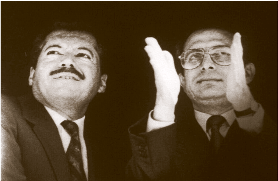
Donald Colosio y Ernesto Zedillo