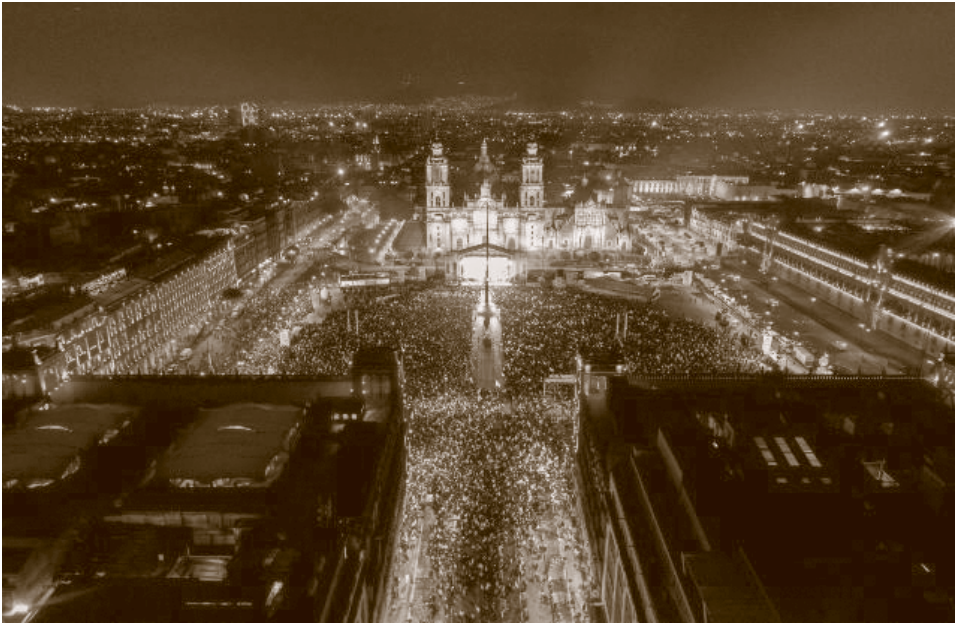
El pueblo congregándose en el Zócalo para celebrar el triunfo electoral.