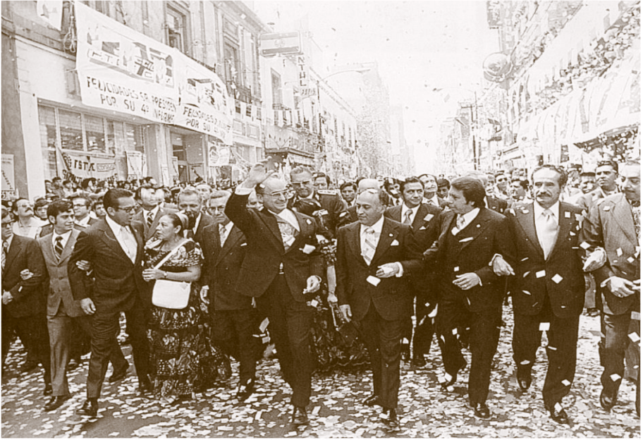
Luis Echeverría, Presidente de México (1970-1976)