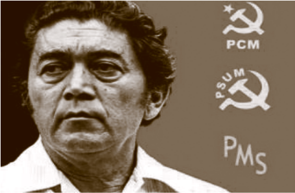
Arnoldo Martínez Verdugo, candidato presidencial del PMS