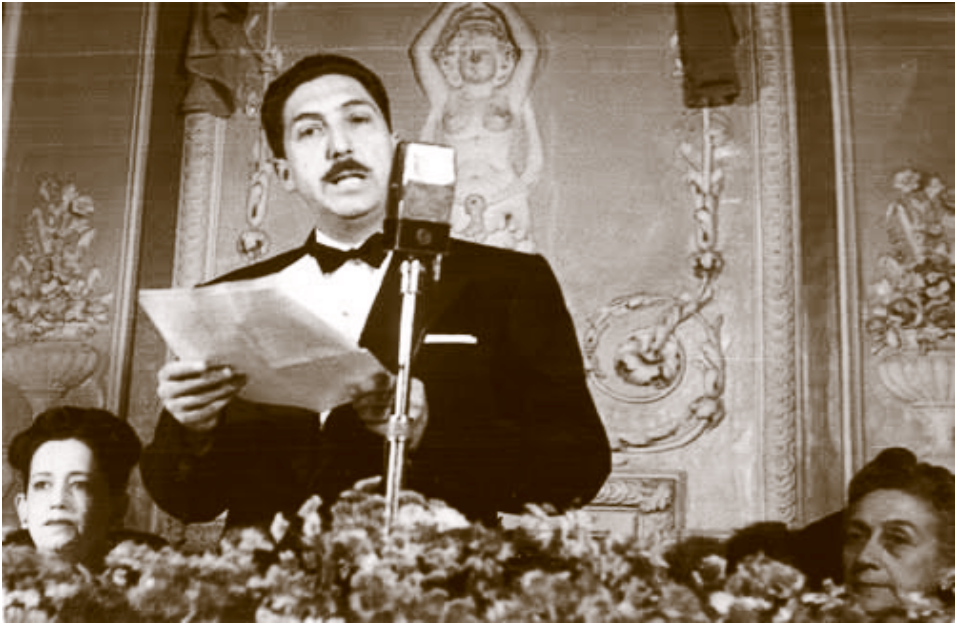
Alemán Valdés, Presidente de México (1946-1952).