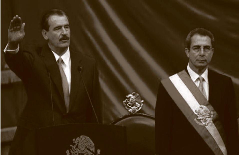
Fox tomando protesta ante Zedillo.