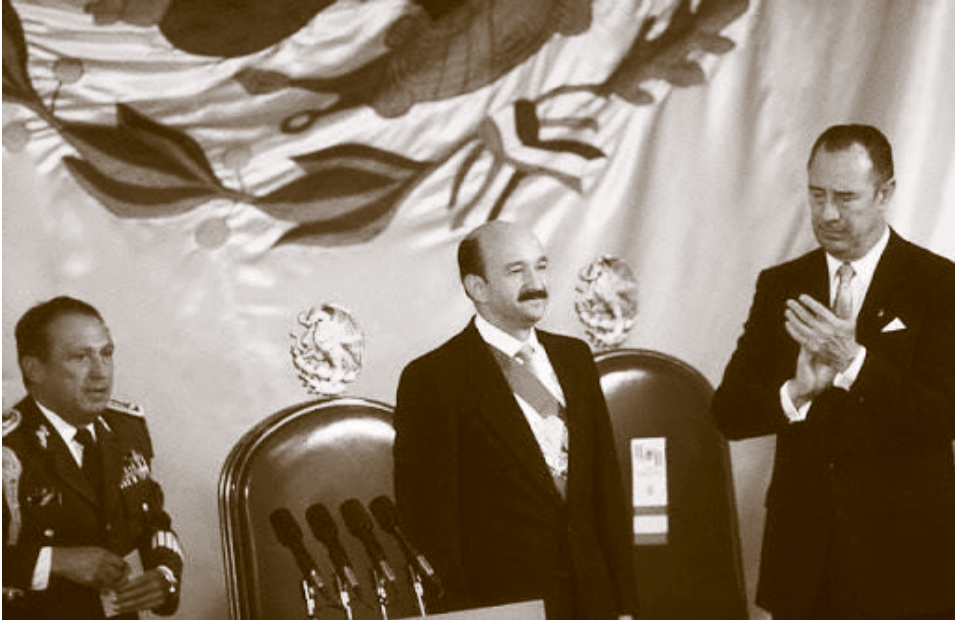
Carlos Salinas de Gortari, Presidente de México (1988-1994)

Fuente: foto del portal memoria política de México