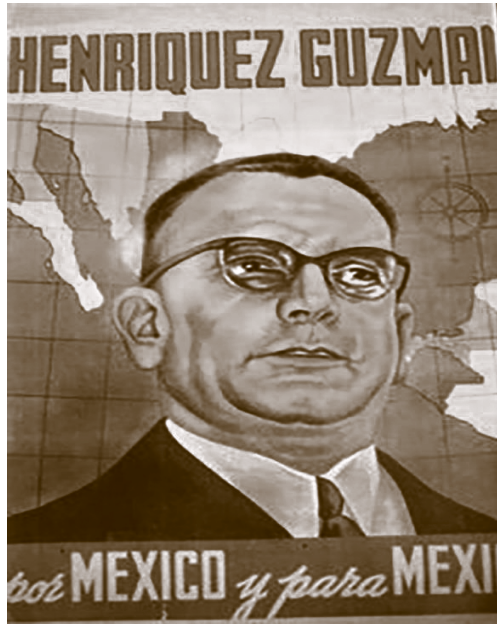
Cartel de campaña de Miguel Henríquez