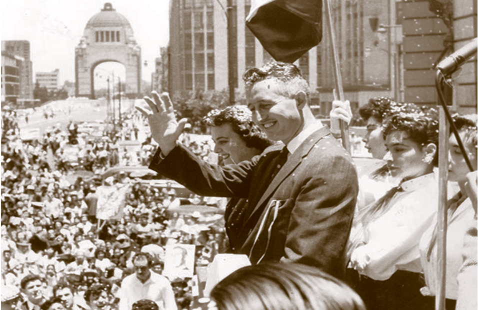
Mitin de Luis H. Álvarez.