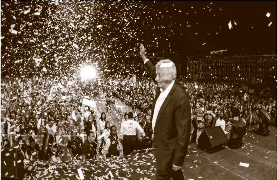
El triunfo de la esperanza