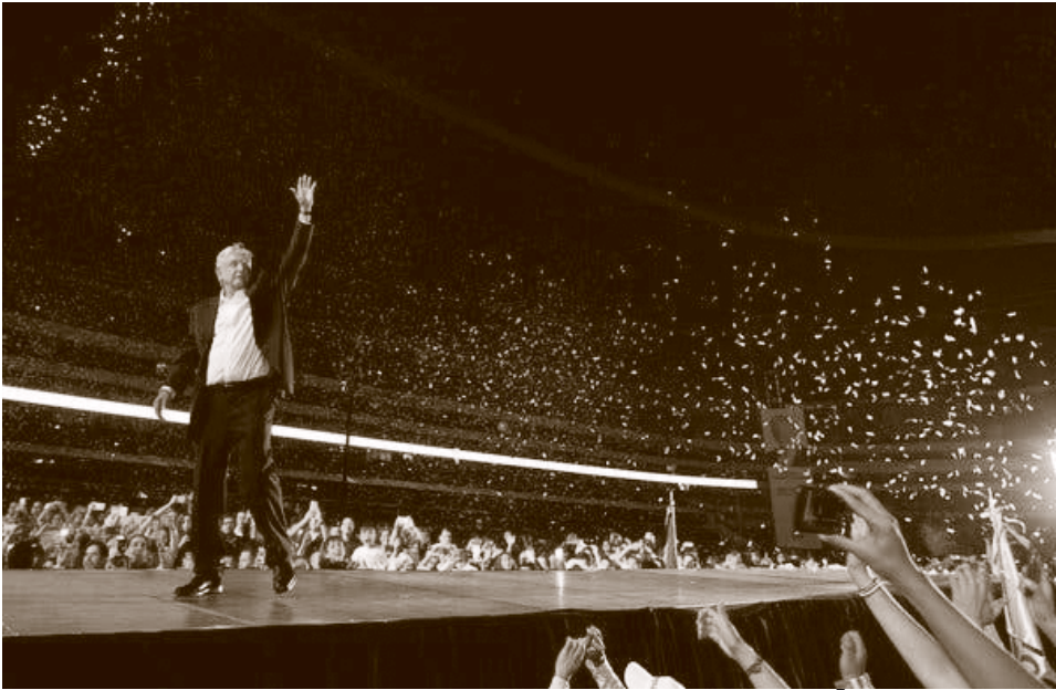
López Obrador cerrando su campaña en el Estadio Azteca