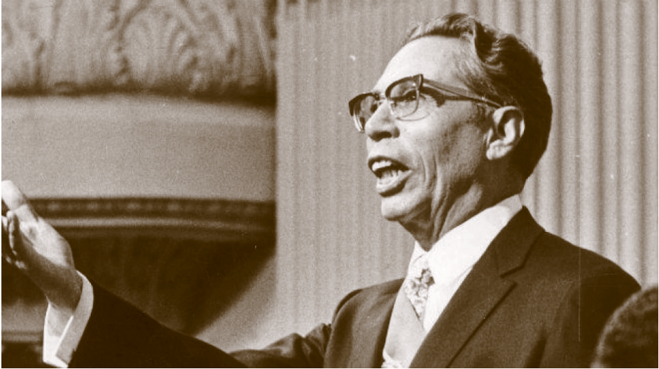
Gustavo Días Ordaz, Presidente de México (1964-1970)