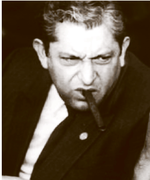
Neme Castillo, candidato a la gubernatura de Tabasco por el PRI.