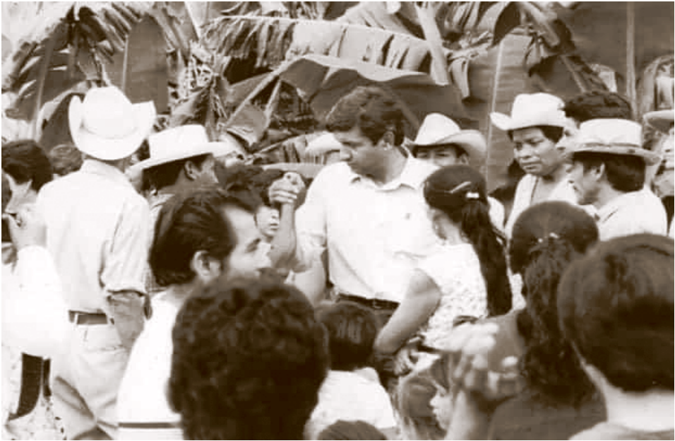
Andrés Manuel y el Éxodo por la Democracia.