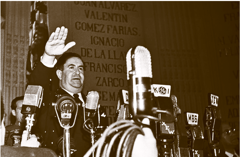
Ávila Camacho protesta como Presidente.