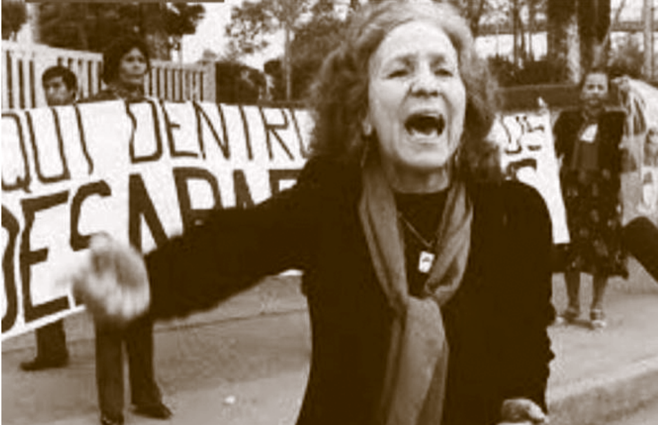
Rosario Ibarra de Piedra candidata del PRT