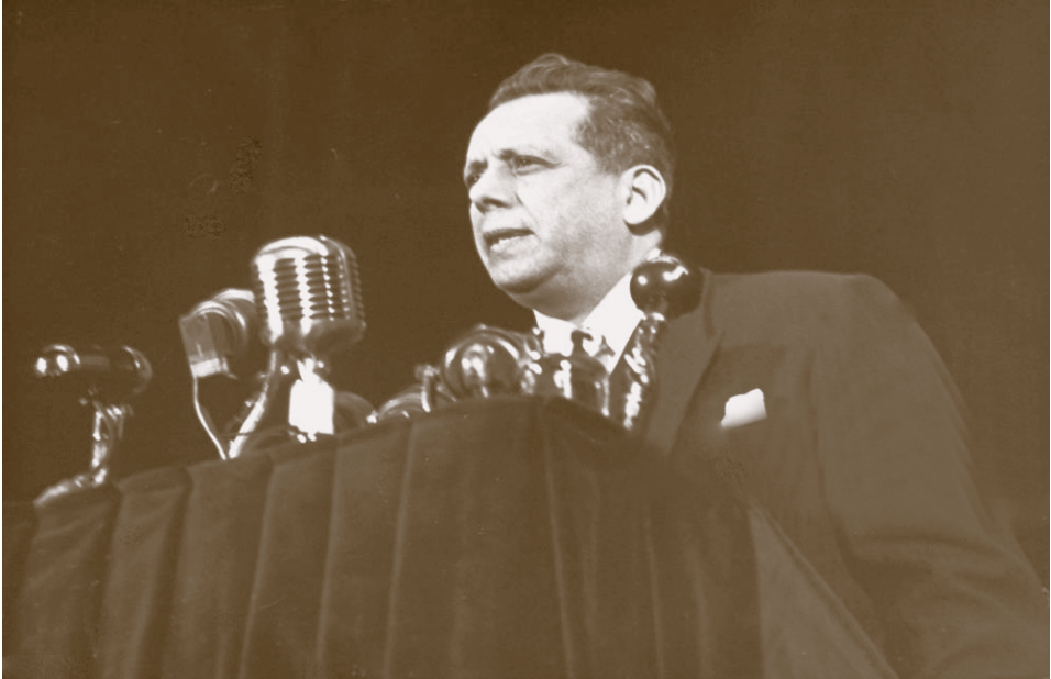
Ezequiel Padilla, candidato presidencial opositor