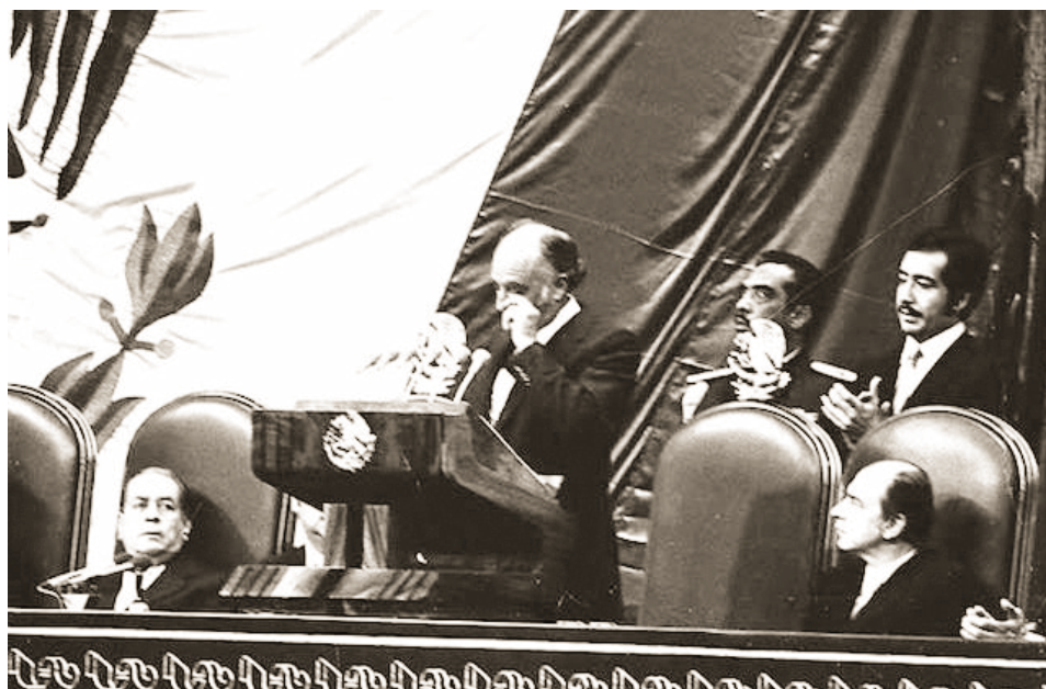
López Portillo llora al dar su informe presidencial.