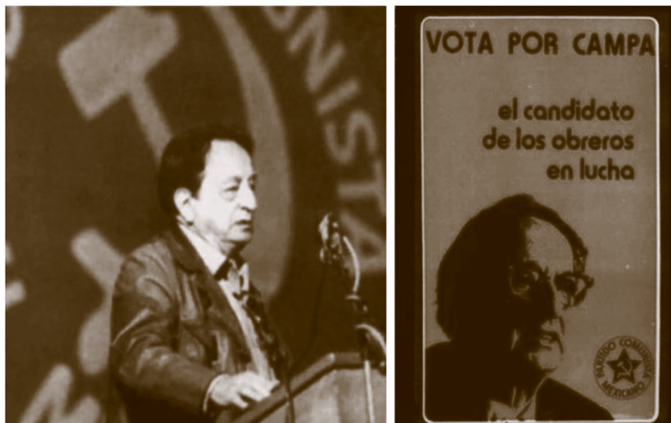
Valentín Campa, candidato del Partido Comunista Mexicano