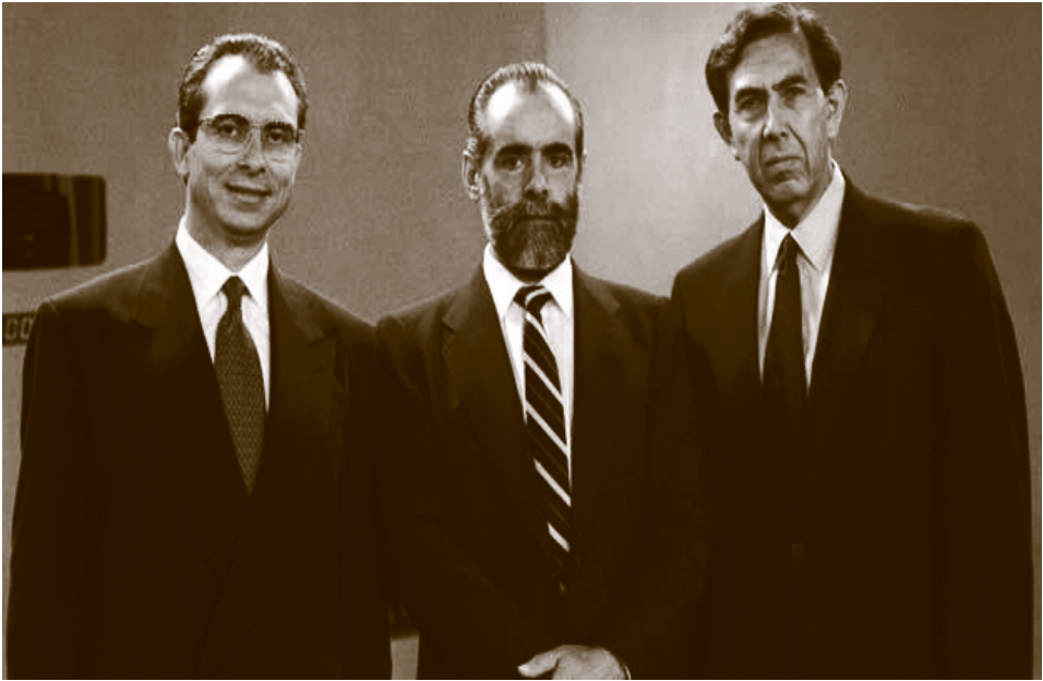
Zedillo, Cevallos y Cuauhtémoc Cárdenas