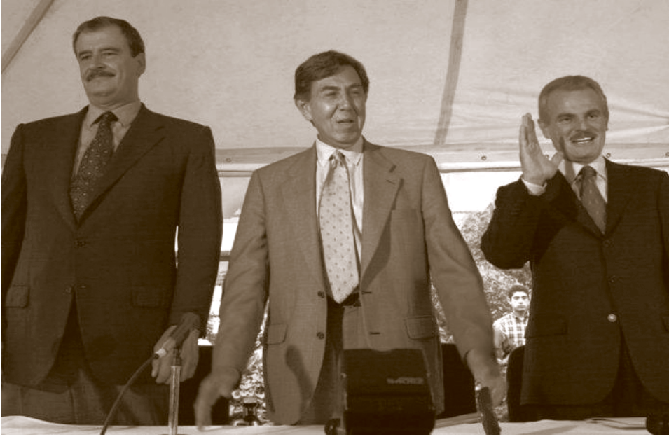
Fox, Cárdenas Solórzano y Labastida, candidatos presidenciales.