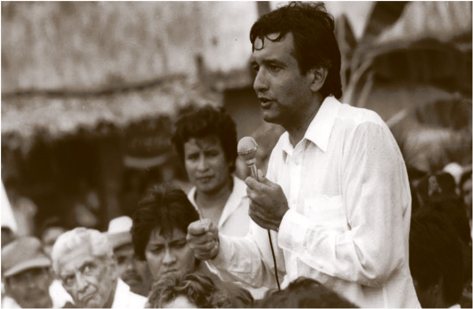
El joven Obrador denuncia el fraude electoral en su contra en Tabasco