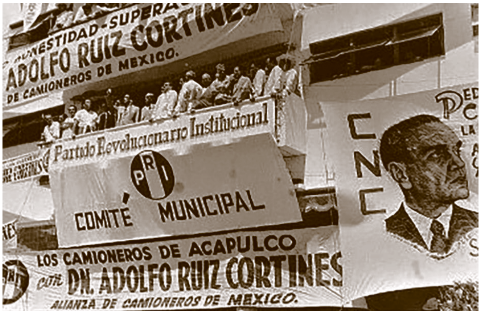
Mitin a favor de Adolfo Ruiz Cortines